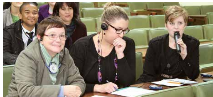
'n Opvoedkundige tolk praat oor 'n mikrofoon terwyl studente deur oorfone na die getolkde lesing luister. Talking is een van die innovasies rakende nuwe metodes van leer en onderrig.

"Die nuwe struktuur met sy personeel is nou uit die wegspringblokke en werk al goed saam om die US se leer- en onderrigdoelwitte te bereik," voeg hy by.